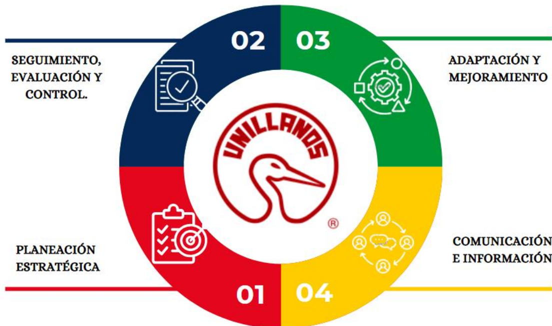
Figura 3 Procesos continuos para la implementación de política de bienestar institucional